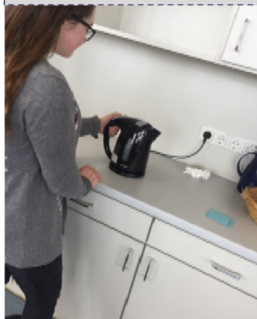
Der neue Wasserkocher im Einsatz

Schülerinnen und Schüler der Oberstufe unterstützen uns regelmäßig beim Catering für Konzerte und andere Veranstaltungen. Manchmal treten sie auch mit einem Wunsch an uns heran: Im Schuljahr 2016/2017 war dies ein Wasserkocher. Den hat der Förderverein gerne finanziert und freut sich, dass das neue Gerät sich großer Beliebtheit erfreut.